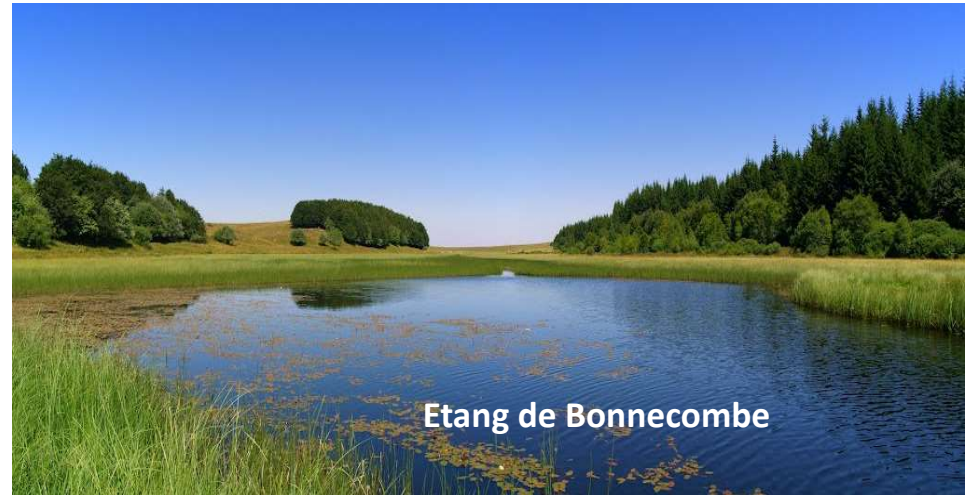
Etang de Bonnecombe

Il est classé ZNIEFF (Zone Naturelle d'Intérêt Écologique et Faunistique) par le Ministère de l'Environnement.