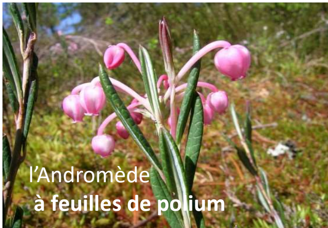
l'Andromède à feuilles de polium

Il est reconnu comme tel pour sa diversité et sa richesse biologique. Plus particulièrement, la tourbière ceinturant l'étang de Bonnecombe est riche en espèces rares. On y retrouve par exemple l'Andromède à feuilles de polium qui s'y développe harmonieusement.